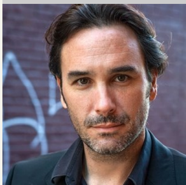
Charles Bender , comédien et metteur en scène